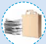
Todo tipo de papel

NUNCA deposites en el contenedor AZUL papel de aluminio, briks, pañales, servilletas y pañuelos de papel sucios, cartón y papel machados de grasa o aceite.