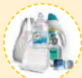
Envases de plástico