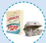
Envases de cartón